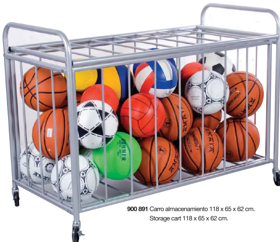
900 891 Carro almacenamiento 118 x 65 x 62 cm. Storage cart 118 x 65 x 62 cm.