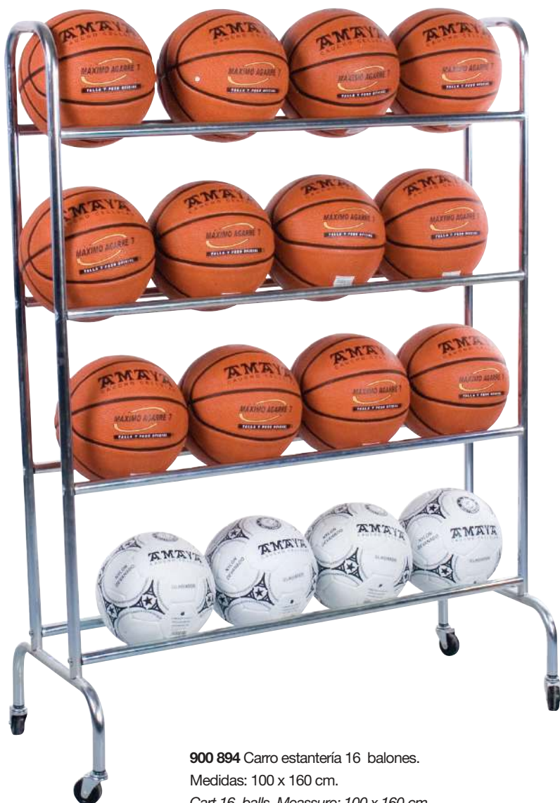
900 894 Carro estantería 16 balones. Medidas: 100 x 160 cm. Cart 16 balls. Measure: 100 x 160 cm.