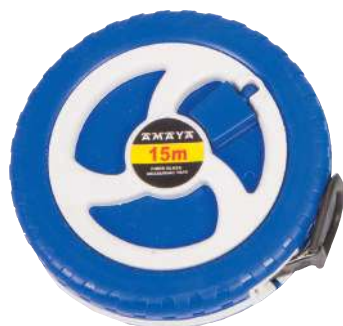
900 860 Cinta métrica 15 m. Metric tape 15 m.