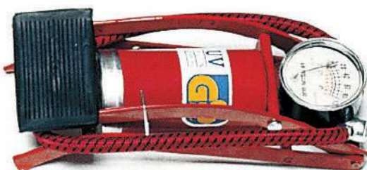
900 907 Bomba hinchado pie. - Air pump for feet.