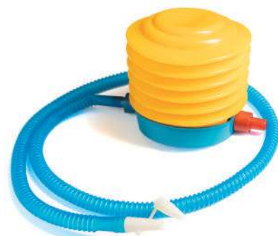
436 802 00 Bomba hinchado básica - Basic air pump.