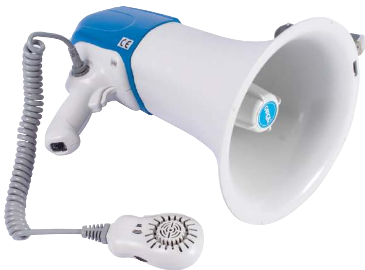
900 870 Megáfono. Potencia 25 W. No incluye baterías. Megaphone. Power 25 W. No batteries included.