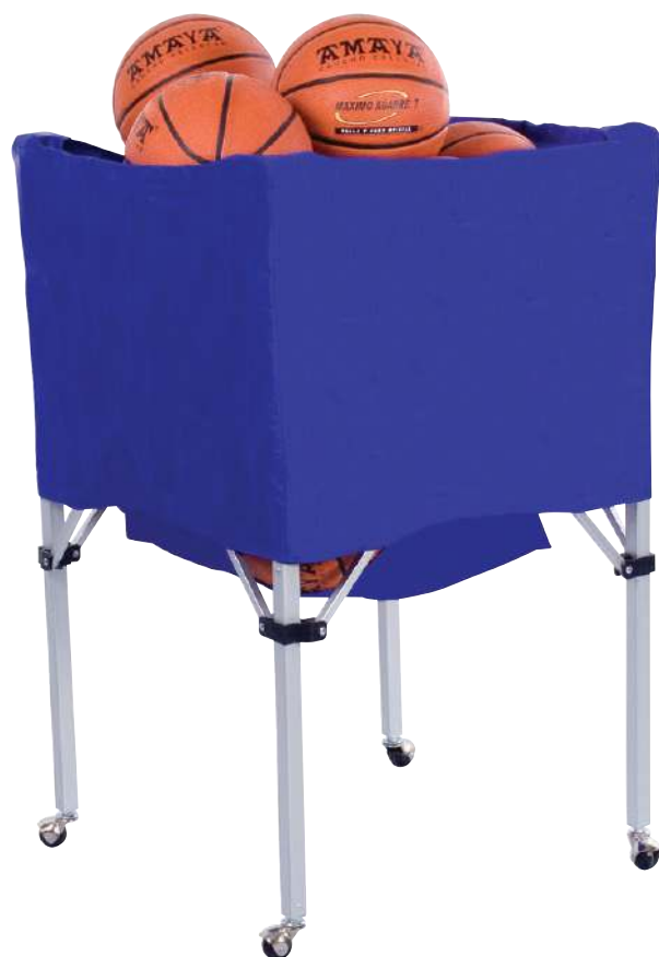
900 890 Carro almacenamiento de lona. Medidas: 75 x 75 x 60 cm. Storage canvas cart. Measure: 75 x 75 x 60 cm.