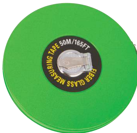
900 862 Cinta métrica 50 m. Metric tape 50 m.