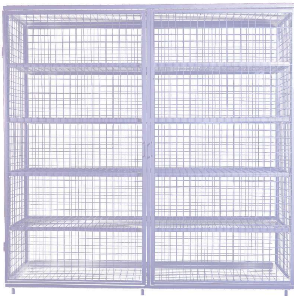
900897 Estantería metálica 2000 x 2000 x 600 mm.

Fabricado con armazón de acero estirado en frío de dimensiones 20 x 20 x 1,5mm. Malla soldada de 50 x 50 con un espesor de 5mm. Todo el armario tratado contra la corrosión. Medidas de 2000 x 2000 x 600 mm. Dispone de 4 estantes metálicos regulables en altura. Sostenido por 6 patas cubiertas de goma de 10 cm, que evitan el deterioro del pavimento. Sistema de apertura de doble puerta con bisagras soldadas al armazón, para facilitar la entrada y recogida de material. Sistema de cierre por candado.