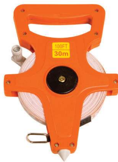
900 863 Cinta métrica 30 m. Metric tape 30 m.