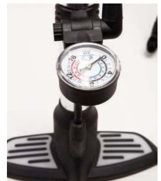
900 909 Bomba hinchado vertical de 60 cm. Vertical air pump 60 cm.